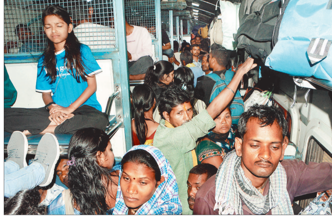
कोरबा-यशवंतपुर ट्रेन की कोच यात्रियों से भरी टसाटस, खड़े होकर करना पड़ रहा सफर।

प्रतिवर्ष गर्मी की शुरुआत होने के साथ ही खेती किसानों का काम बंद हो जाता है। वहीं बारिश के मौसम में निर्माण कार्यों के रुकने के बाद ग्रामीण दोबारा अपने काम में लग जाते हैं। गर्मी के मौसम में खाली होने की वजह से कमाने-खाने के लिए मजदूर हजारों की संख्या में बाहर निकल जाते हैं। प्रदेश के बिलासपुर के साथ दुर्गा, राजनांदगांव, रायपुर, रायगढ़ के अलावा कोरबा से भी बड़ी संख्या में मजदूरों की संख्या ट्रेनों में अधिक हो जाती है, जो अपने परिवार व बच्चों के अलावा पूरा घर का साजो सामान लेकर ट्रेन से दिल्ली, अमृतसर, जम्मू और अन्य मेट्रो स्टेशन की ओर रवाना होते हैं। इन मजदूरों की संख्या सबसे अधिक दुर्गा से रायपुर, भाटापापा, दाधापारा से डायवर्ट होकर उसलापुर होते हुए कटनी की ओर निकलने वाली दुर्गा-जम्मूतवी विस्तारित उधमपुर, दुर्गा-हजरत निजामुद्दीन संपर्कक्रांति, बिलासपुर से होकर जाने वाली पुरी-हरिद्वार उत्कल एक्सप्रेस, विशाखापट्टनम-अमृतसर हीराकुंड एक्सप्रेस में होती है। एसी कोच को छोड़कर और जंगल कोच में भीड़ अधिक होने के कारण मजदूर और उनका परिवार स्लीपर कोच में सफर करना है, जिसे ईएफटी काटकर टीटीई सफर करने की अनुमति दे देते हैं। इसके कारण दो माह पहले बुकिंग कराने वाले यात्रियों को कोच में भी चलने की जगह नहीं मिल पा रही है।