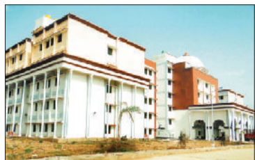
यूनिवर्सिटी रायगढ़ में कुलपति पद के लिए नियुक्ति प्रक्रिया चल रही है। इसलिए छात्र-

नाम संभागायुक्त को ज्ञापन सौंपा है। अटल यूनिवर्सिटी और रायगढ़ यूनिवर्सिटी में स्थानीय शिक्षाविदों को कुलपति बनाए जाने की मांग करने वाले छात्र-छात्राओं का कहना है कि हमारे राज्य छत्तीसगढ़ में शिक्षा, शोध एवं अकादमिक क्षेत्र में अनेक योग्य, अनुभवी और प्रतिभाली स्थानीय शिक्षाविद उपलब्ध हैं जिन्होंने वर्षों से प्रदेश में शिक्षा के विकास में महत्वपूर्ण योगदान दिया है। वर्तमान में अटल यूनिवर्सिटी एवं शहीद नंदकुमार पटेल